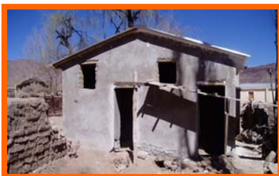
Baños e duchas na escola da Comunidade de Pelca