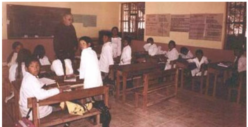
Escola da Comunidade de Pelca, á que asisten uns setenta nenos e nenas tanto desa comunidade coma doutras lindantes.